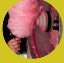
Confection de barbe à papa