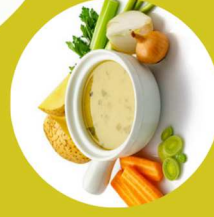
Y'a quoi dans ta soupe