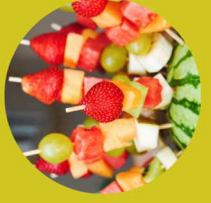
Brochettes de fruits