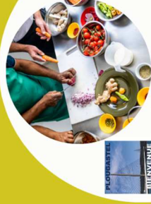
Atelier cuisine (sur inscription) : Saveurs sucrées, salées, de l'envie à la dégustation pour dire non au gaspi !