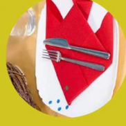
Décoration de table en serviette