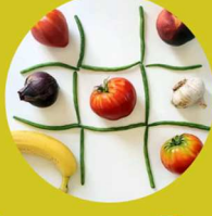
Jeu des 4 saisons