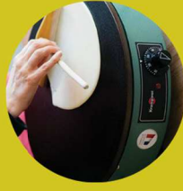
Initiation à la billig