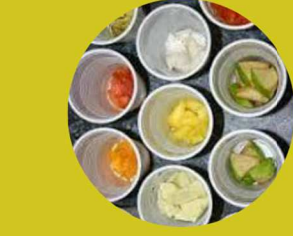
Jeu Kim goût